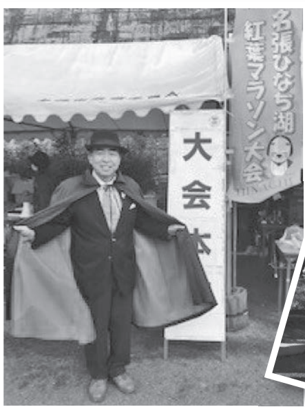
▲比奈知湖紅葉マラソン大会