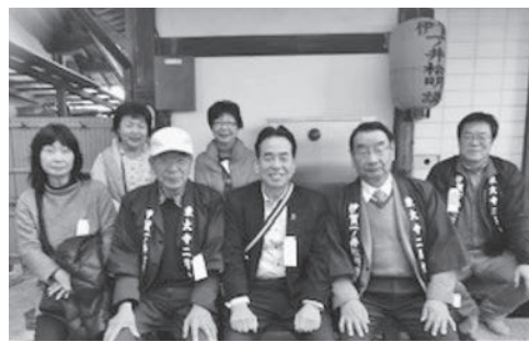
▲東大寺お水取り二月堂へ松明調進行事