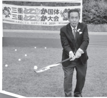
▶「三重とこわか国体」 ホッケー競技体験